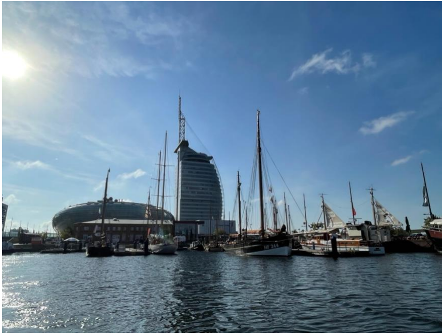
Die Havenwelten Bremerhaven